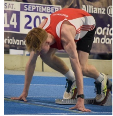
Länderkampf in Belgien