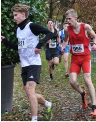
Deutsche Cross in Riesenbeck