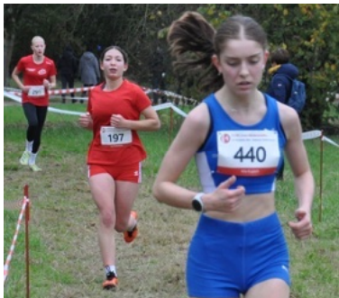
Westfälische Cross Schloss Neuhaus