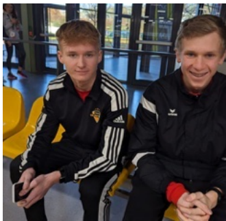
Westfälische Halle Dortmund